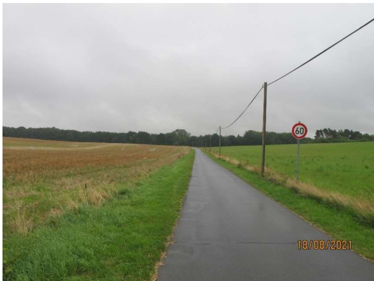
Blick von Bastorf Richtung Hohen Niendorf